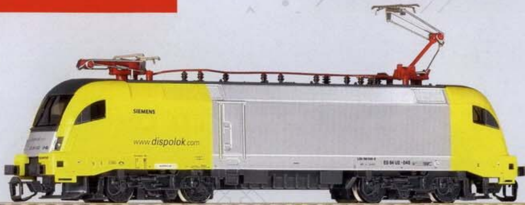
47411 Siemens Dispolok ES 64 U2 Ep. V