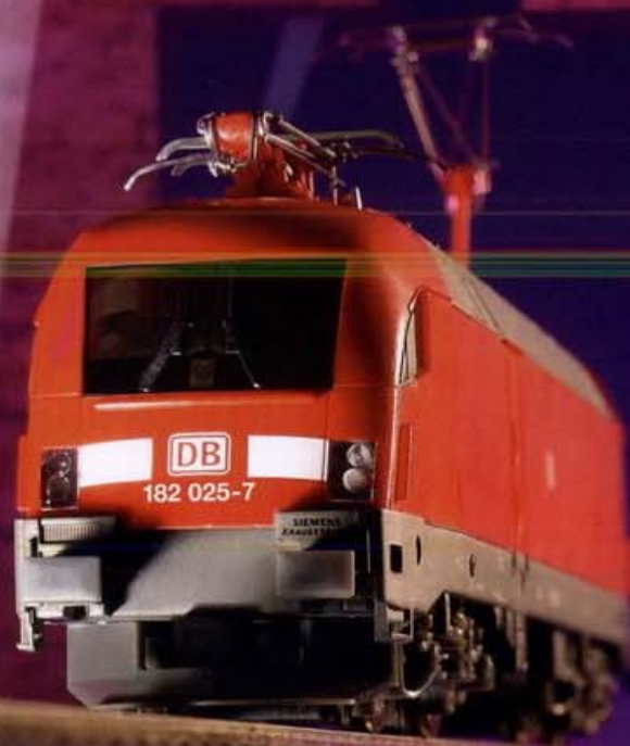
47410 Elektrolok BR 182 DB AG Ep. V