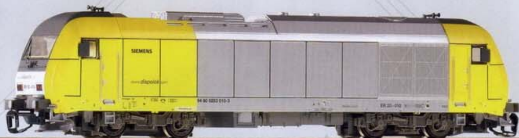
47581 Diesellok ER20 „Siemens Dispolok“ Ep. V