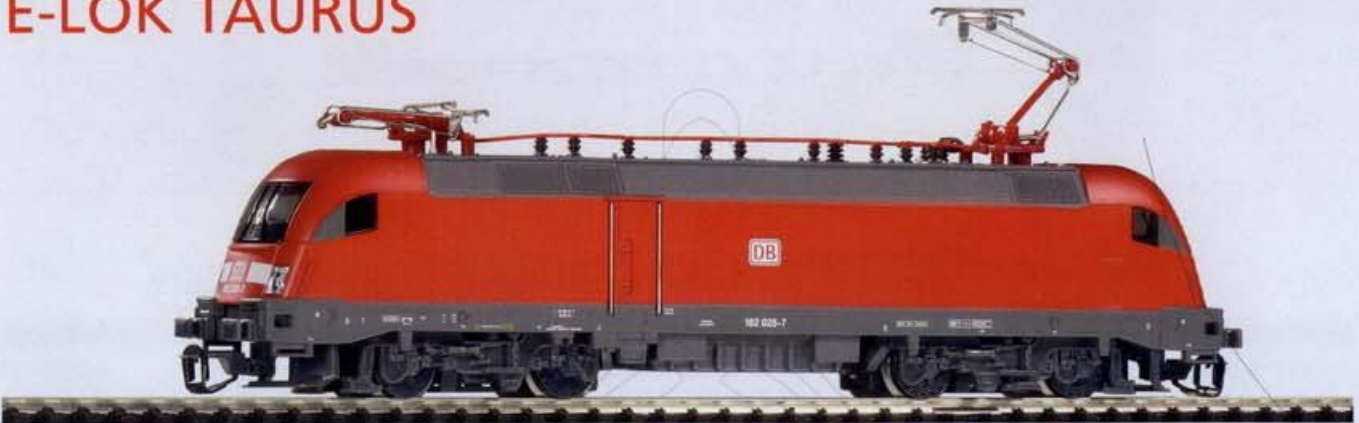
47410 Elektrolok BR 182 DB AG Ep. V