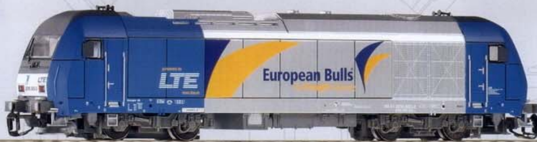
47582 Diesellok Herkules 2016 903-3 „LTE European Bulls“ Ep. V