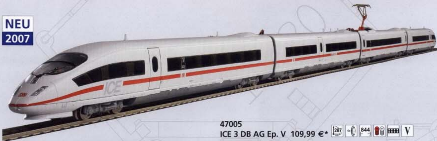
47005 ICE 3 DB AG Ep. V 109,99 €*

Am 9. Juli 1999 stellte die DB AG ihren neuen ICE 3 der Öffentlichkeit vor. Neu bei diesem Triebwagen ist das Antriebskonzept, welches sich über den ganzen Zug verteilt. 16 Fahrmotoren bringen eine Leistung von 8000 kW, beschleunigen den Zug von 0-100 km/h in 50 sec., seine Höchstgeschwindigkeit beträgt 330 km/h.