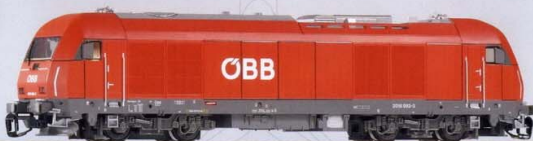
47580 Diesellok Herkules Rh2016 ÖBB Ep. V