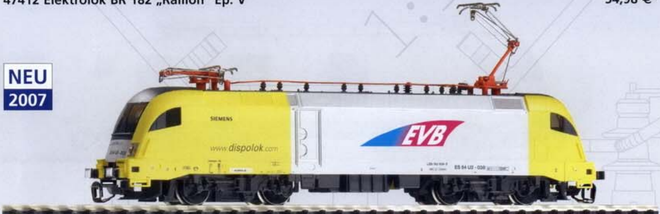
47417 Elektrolok Taurus ES 64 U2-038 „EVB-Eisenbahn und Verkehrsbetriebe Elbe-Weser GmbH“ Ep. V